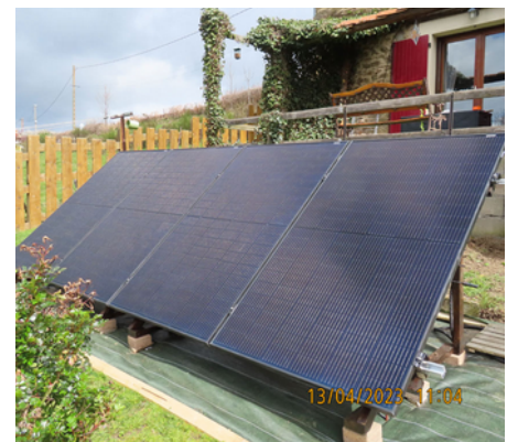
Exemple d'installation d'un kit au sol de 4 panneaux sur support autoconstruit

En maîtrisant votre consommation, (voir notre rubrique « écogestes ») et en utilisant un kit avec des panneaux photovoltaïques, vous contribuerez de manière durable à la protection de la planète.